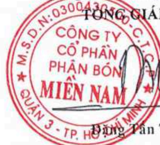
Đặng Tân Thành