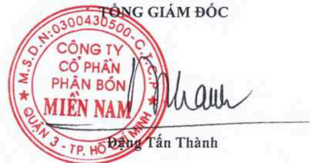
Đặng Tấn Thành