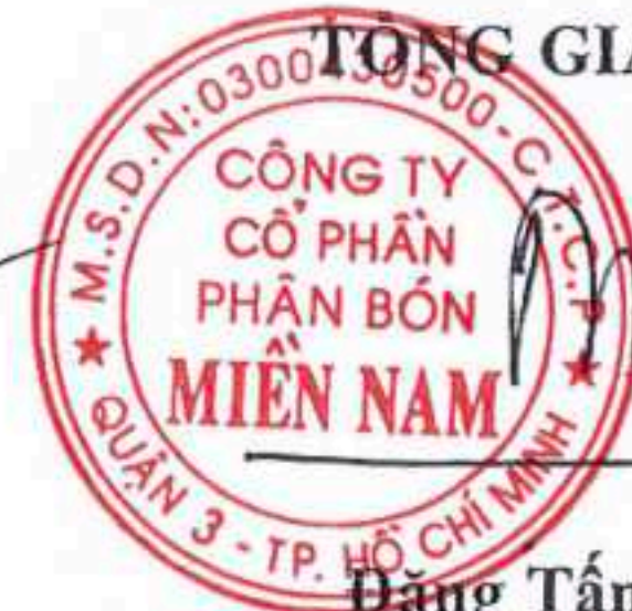
Đặng Tấn Thành