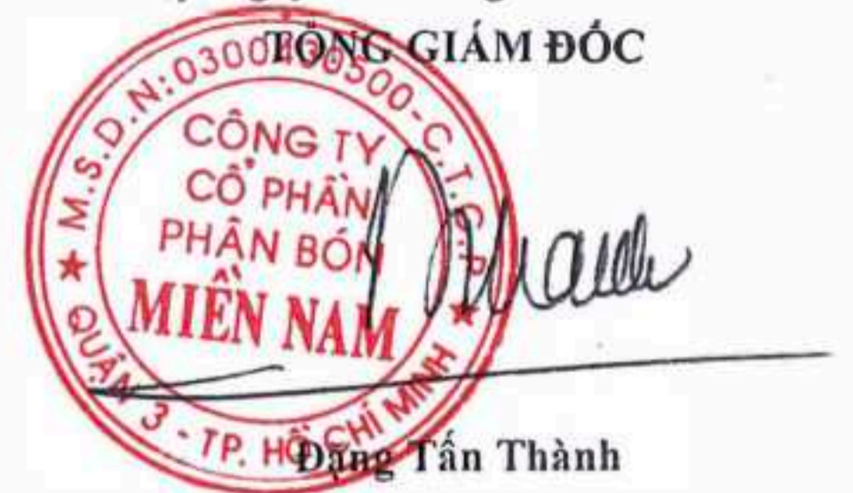
Đặng Tấn Thành